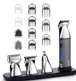
MT996E 20 € CASHBACK*