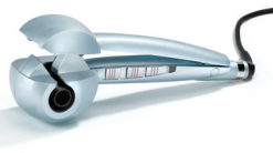
C1700E 20 € CASHBACK*