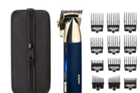
E992E 20 € CASHBACK*