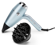
D773DE 10 € CASHBACK*