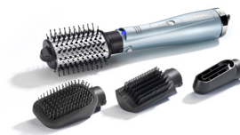
AS774E 10 € CASHBACK*