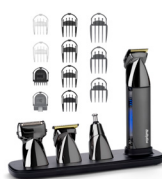
MT991E 20 € CASHBACK*