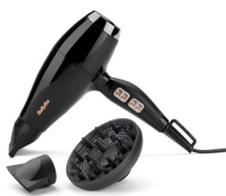
6716DE 10 € CASHBACK*