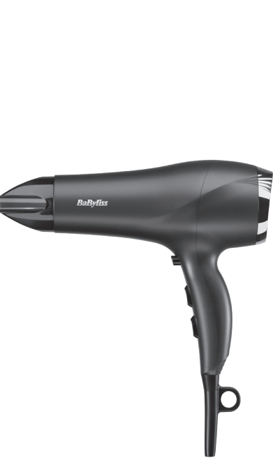
Fabriqu  en Chine Made in China